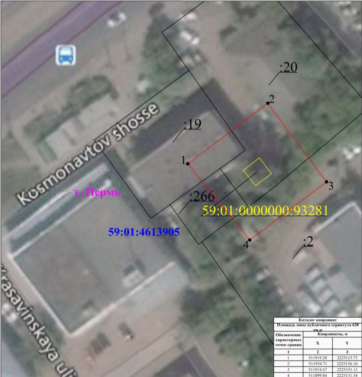
Схема расположения границ публичного сервитута для эксплуатации объекта БКТП - 7462 (наименование объекта)